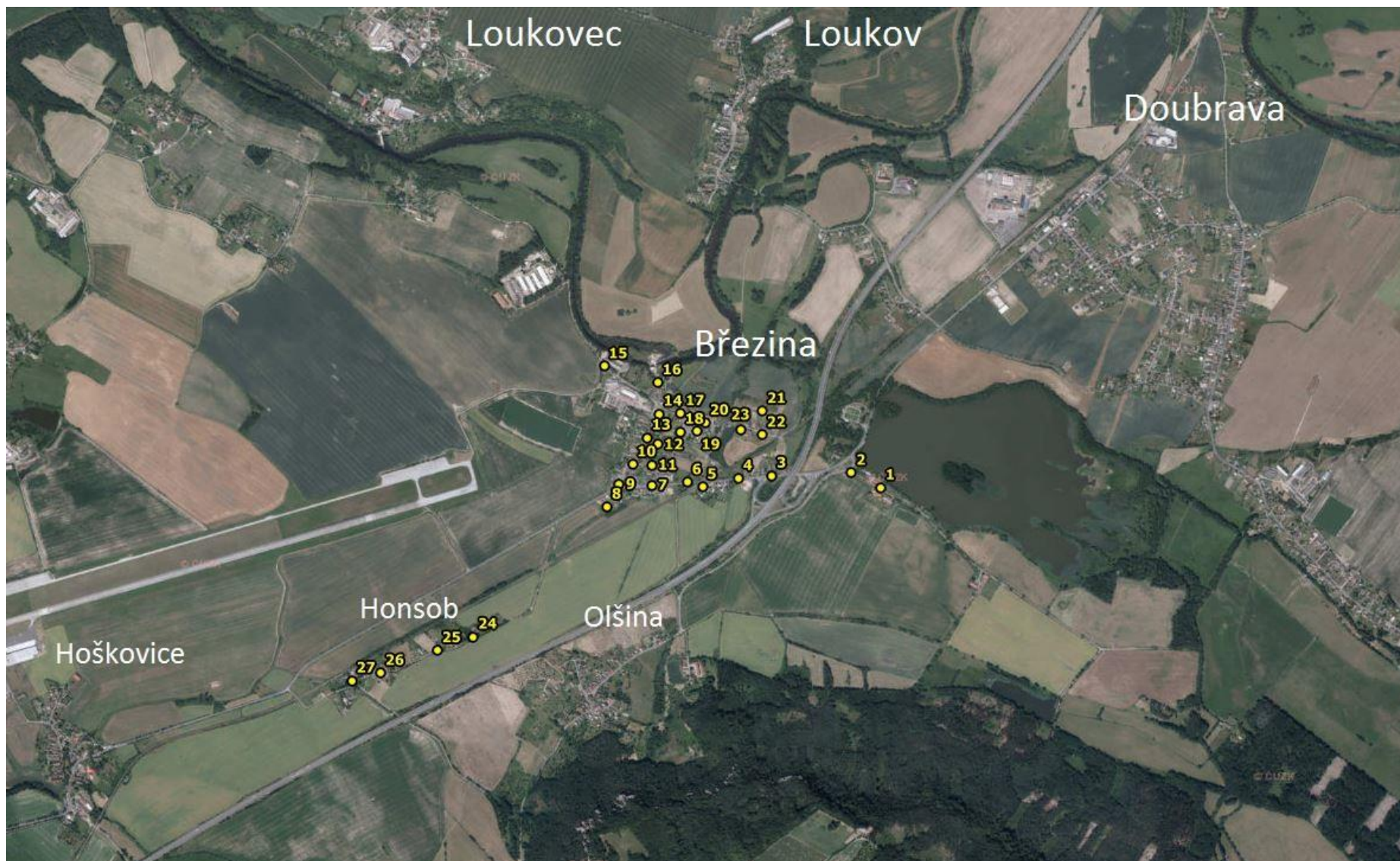
Rozmístění hlásičů v obci Březina – celkový náhled