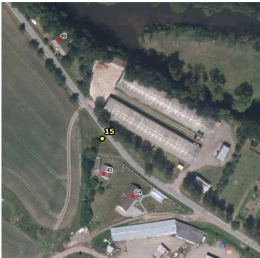
Umístění hlásičů v obci Březina – detail 6