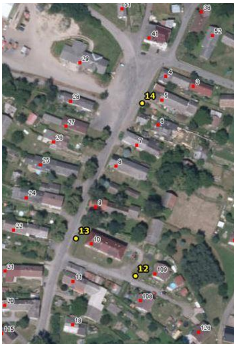
Umístění hlásičů v obci Březina – detail 5