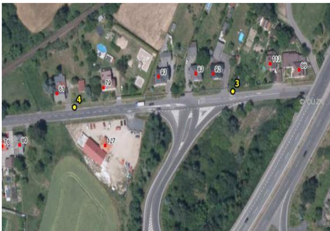
Umístění hlásičů v obci Březina – detail 2