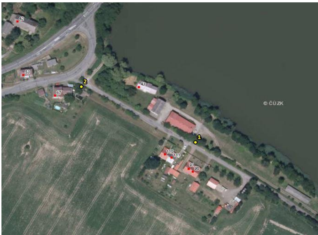
Umístění hlásičů v obci Březina – detail 1 (rybník Žabakor)