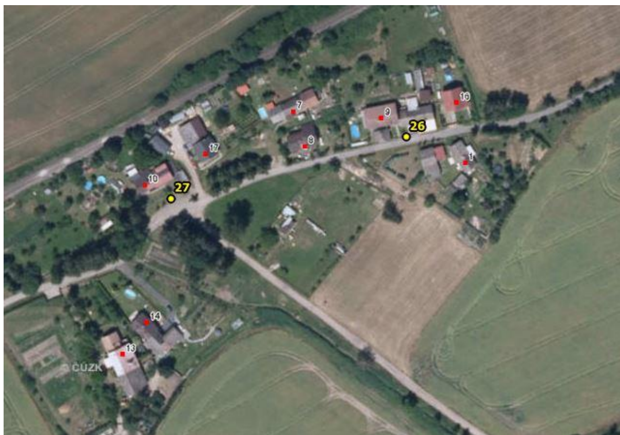
Umístění hlásičů v obci Březina (Honsob) – detail 11