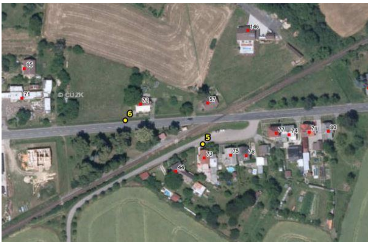
: Umístění hlásičů v obci Březina – detail 3