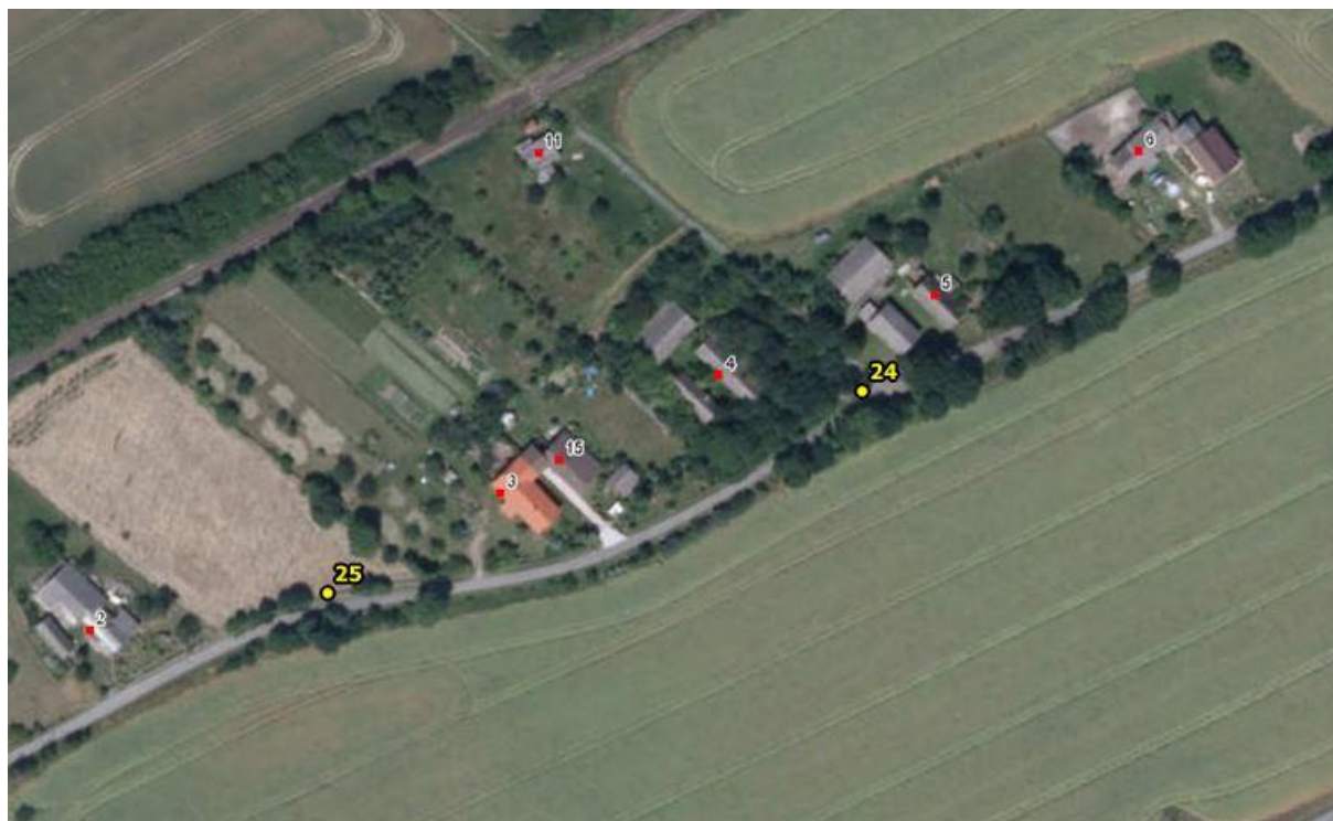
Umístění hlásičů v obci Březina (Honsob) – detail 10