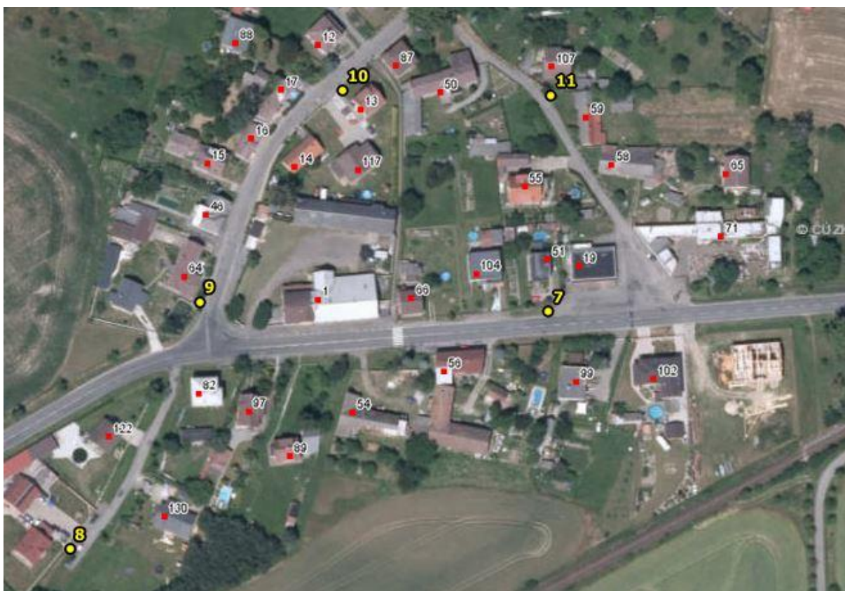
Umístění hlásičů v obci Březina – detail 4