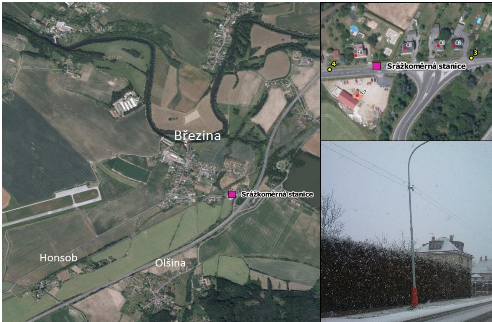
Umístění srážkoměrné stanice na sloupu veřejného osvětlení nedaleko domu č. p. 79 v obci Březina (žluté body znázorňují plánované hlásiče, červené body značí čísla popisná)