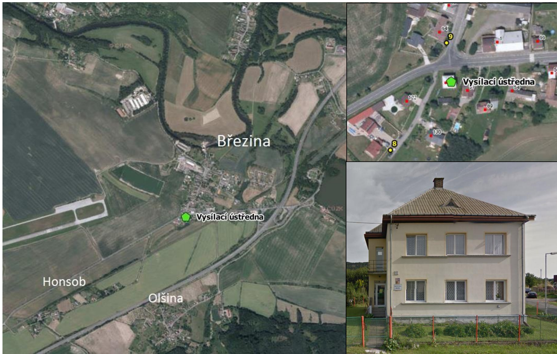
Umístění vysílací ústředny v budově úřadu obce Březina (žluté body znázorňují plánované hlásiče, červené body značí čísla popisná)