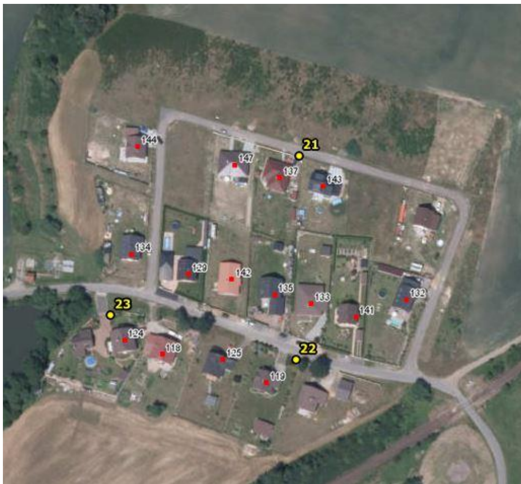
Umístění hlásičů v obci Březina – detail 9