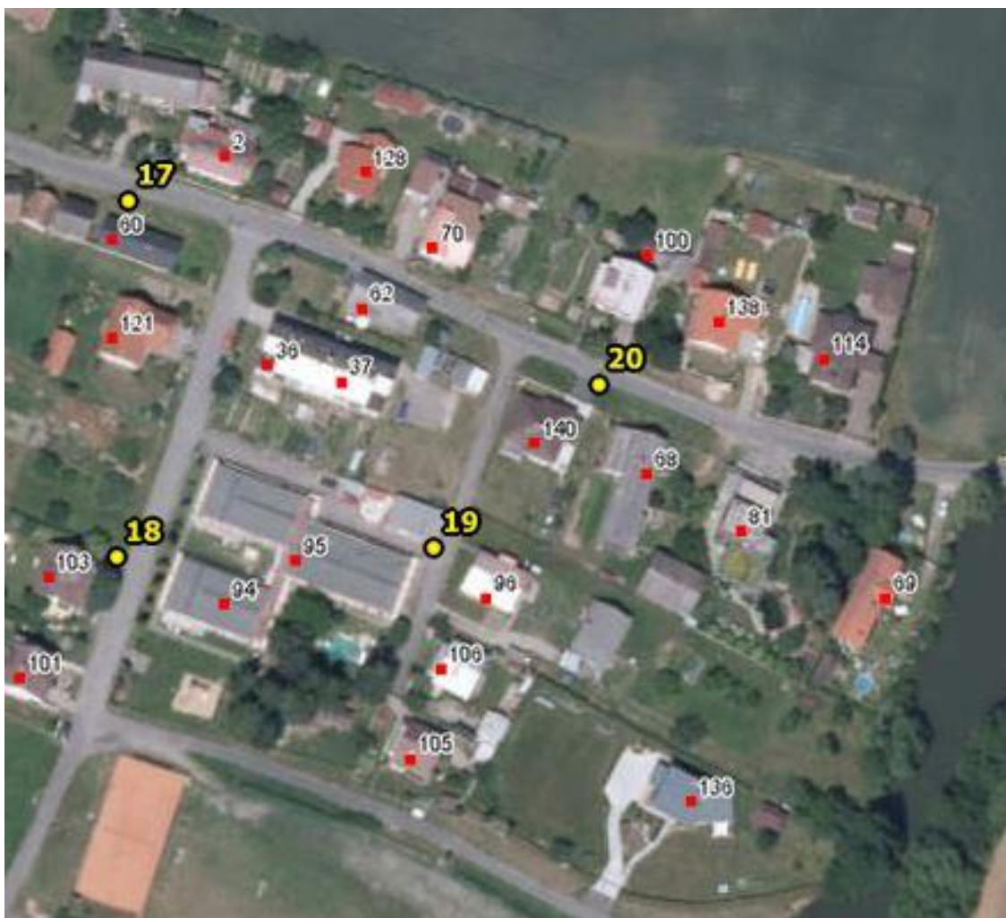
Umístění hlásičů v obci Březina – detail 8